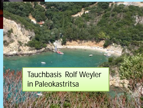
Tauchbasis Rolf Weyler in Paleokastritsa